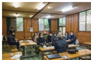
▲レクチャー (イメージ)

日本は国土面積の67%が森林に覆われた世界有数の森林国です。森林は木材などの資源を供給しているだけでなく、貴重な自然や動植物（生物多様性）を保護したり、地球温暖化防止、Co2 吸収・固定、水源かん養、山崩れ防止などの公益的機能（＝森林が人へもたらす恩恵）など様々な役割を果たしています。これら森林の大切さをレクチャーと体験を通して学びます。