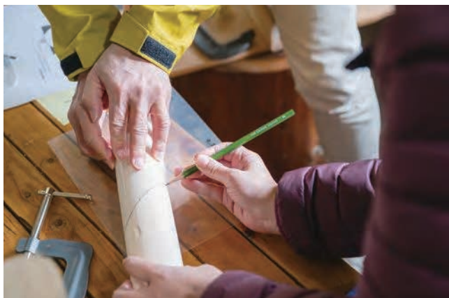
▲モルック作り (イメージ)