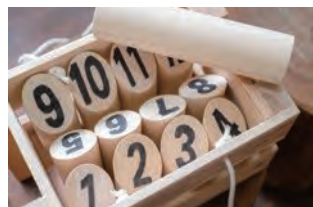
▲県産材を使って作成するモルック (イメージ)