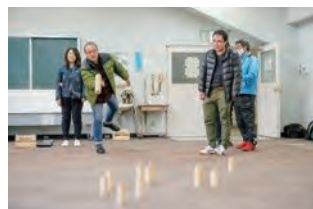
▲モルック (イメージ)