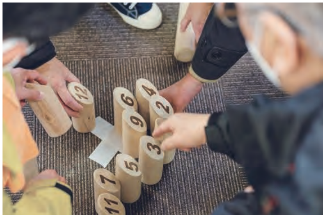
▲モルック (イメージ)