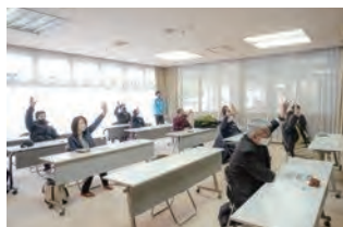
▲レクチャー (イメージ)

ニュースポーツはレクリエーションスポーツとも呼ばれ、一般に、勝敗にこだわらず誰でも、何歳でも取り組める身体運動を指します。本プログラムではポッチャやモルックといったニュースポーツ体験を通して、本当の『障がい』『バリア』が個人個人の心の中にあることに気づくことを目的としています。思い込みや決めつけを取り払い、相手の視点や考えを理解すること、相互に表現して伝えあうことの重要性を再認識するためのプログラムです。