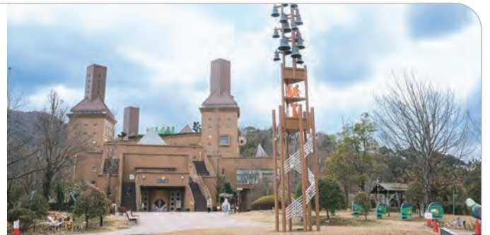
えひめこどもの城

えひめこどもの城は、子どもたちが遊びや交流を通して様々な体験活動を行うことにより、創造力や自主性、社会性、豊かな感性などを育むことができるよう、県立の児童厚生施設として、平成10年10月に開園しました。園内には、ふれあいの森、こどものまちゾーン、冒険の丘、創造の丘、環境体験学習コーナーなど色々な体験ゾーンや各種遊具を設けており、屋内施設も充実していて全天候型の施設です。