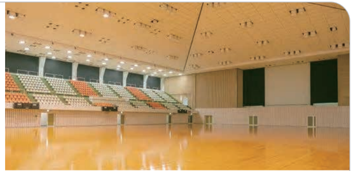
愛媛県総合運動公園

愛媛県総合運動公園は愛媛県が県民のスポーツ振興をはかるとともに幅広いレクリエーション活動に対応するため、霊峰石鎚連峰と美しい自然を背景とした丘陵地にスポーツ施設を中心に、昭和55年5月に開園しました。陸上競技場・体育館・球技場・テニスコート・多目的広場・弓道場などのスポーツ施設を有し、トップアスリート（プロスポーツ）から一般の方まで幅広く利用できる都市公園です。公園内には、中央広場、子ども広場、散歩できる森などもあり、県内外の人々から親しまれています。