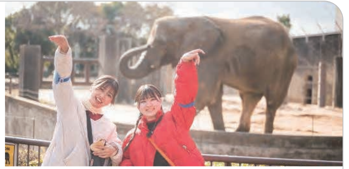
愛媛県立とべ動物園

愛媛県立とべ動物園は、現在150種約640点の動物を展示し、その内容規模とも西日本有数の動物園として、県民に愛され親しまれています。10のゾーンに分かれた園内は、案内板や動物の解説ラベルなどを配置し、動物をよりわかりやすく楽しく観察できるよう工夫されています。